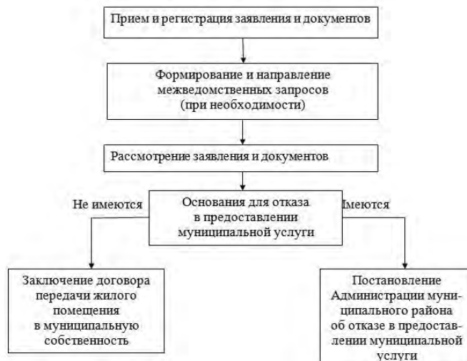
Блок-схема предоставления муниципальной услуги

Приложение № 3 к Административному регламенту по предоставлению муниципальной услуги «Передача жилых помещений, ранее приватизированных гражданами, в муниципальную собственность