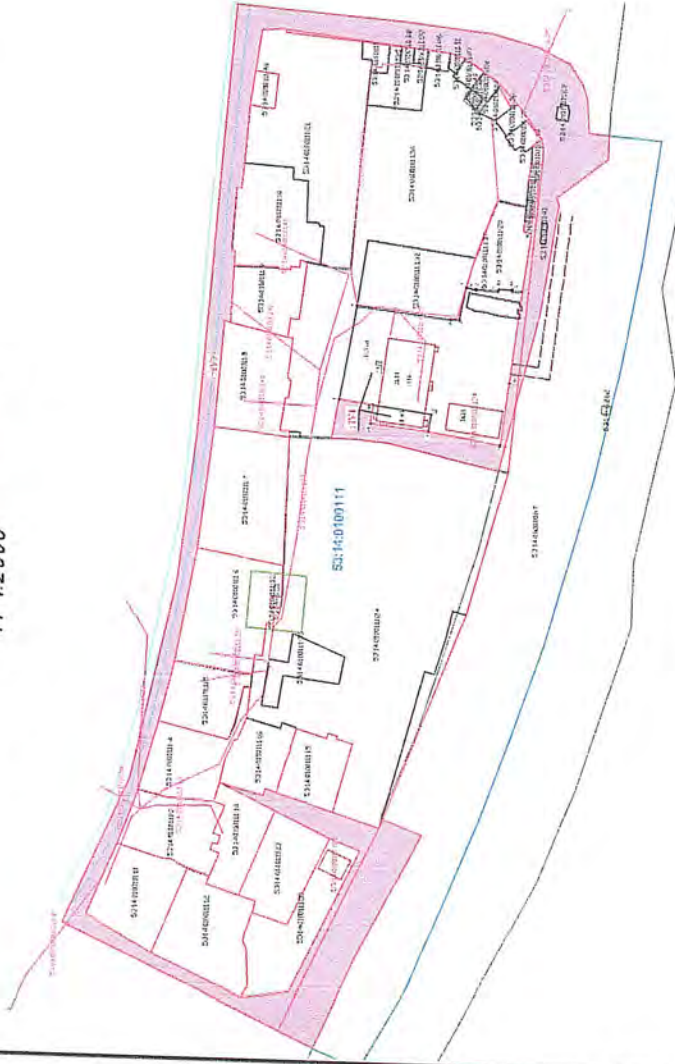
Чертеж межевания территории М 1:2000