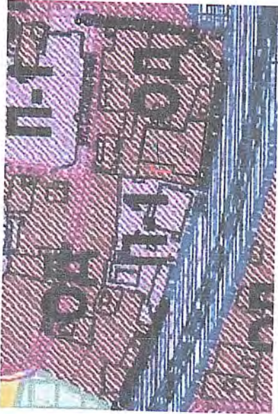
Схема расположения земельных участков в границах элемента планировочной структуры (квартале)