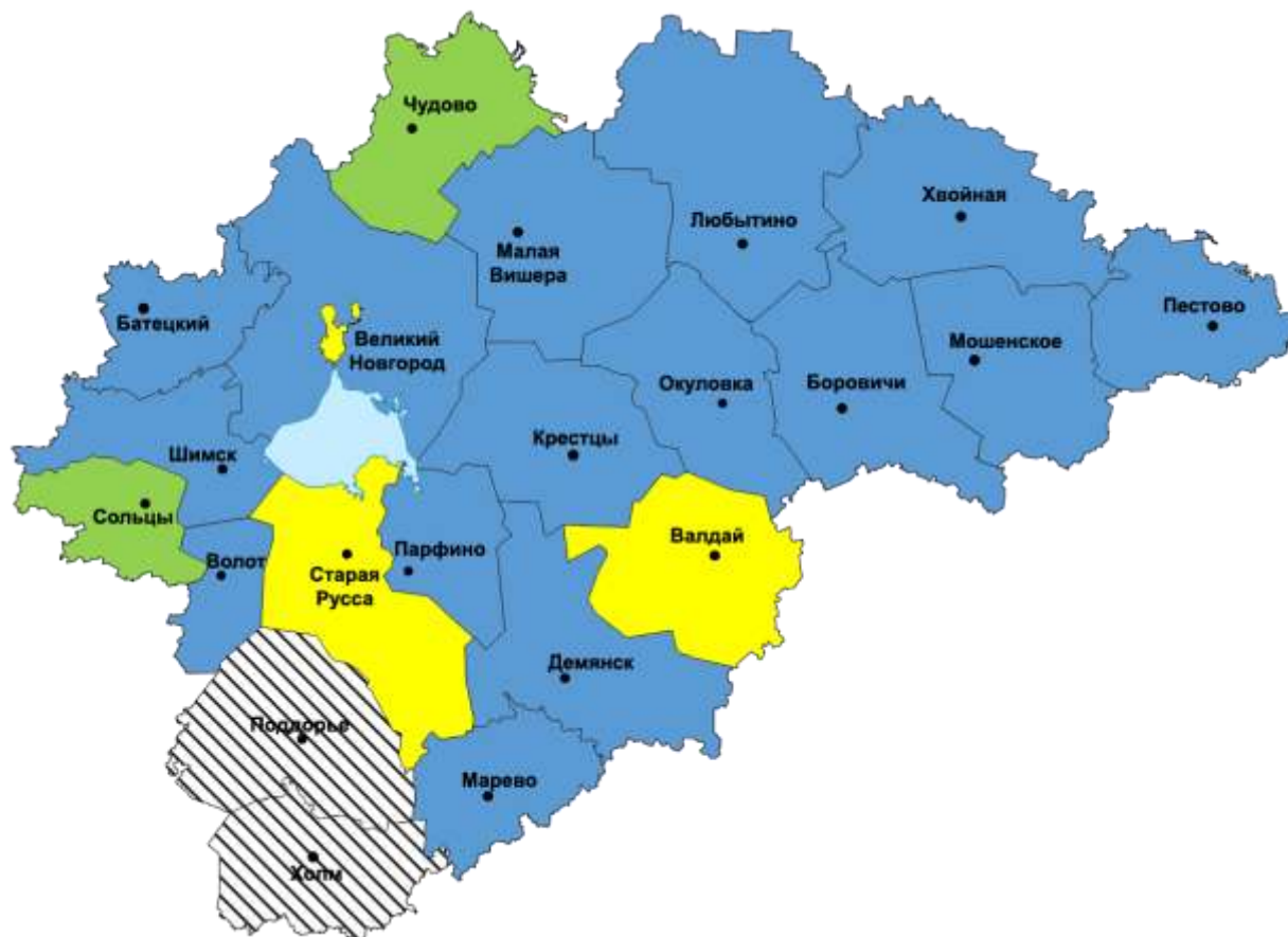
Рис. 4. Значения показателя «Общая заболеваемость наркоманией и обращаемость лиц, употребляющих наркотики с вредными последствиями» по области и в разрезе городского округа и муниципальных районов, с распределением по интервалам (2019 год)*

Условные обозначения интервалов состояния наркоситуации