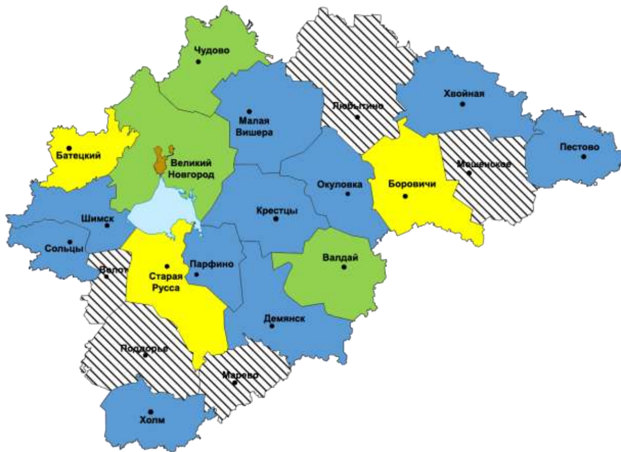
Рис. 1. Значения показателя «Удельный вес наркопреступлений в общем количестве зарегистрированных преступных деяний» по административным территориям Новгородской области, с распределением по интервалам (2019 г.)

Условные обозначения интервалов состояния наркоситуации