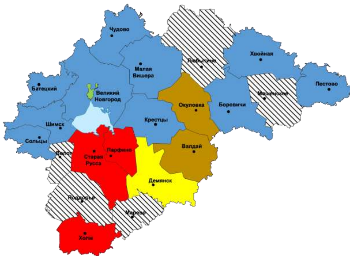
Рис. 3. Значения показателя «Криминогенность наркомании (влияние наркотизации на криминогенную обстановку)» по административным территориям Новгородской области, с распределением по интервалам (2019 г.)

Условные обозначения интервалов состояния наркоситуации